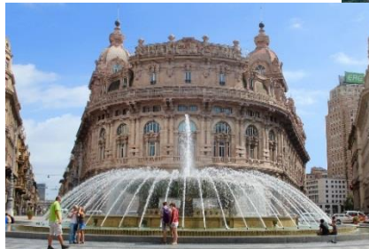
ジェノバ フェッラーリ広場