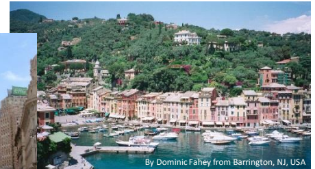
ジェノバ 漁村ポルトフィーノ