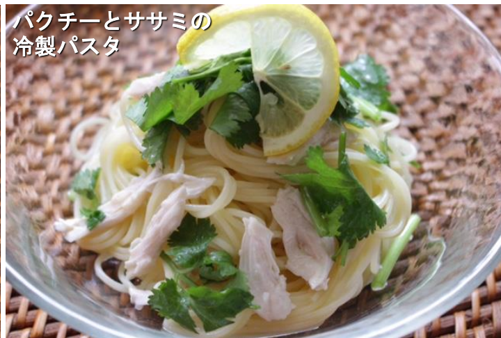
パクチーとササミの冷製パスタ