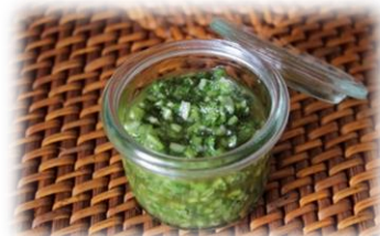
パクチー塩レモンダレ