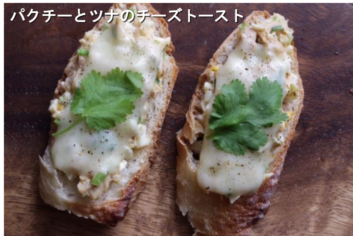
パクチーとツナのチーズトースト