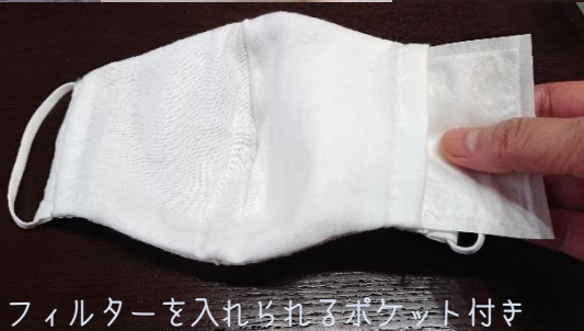
フィルターを入れられるポケット付き

フィルターを入れられるポケット付きのマスクを手縫いで作ります。使用した型紙は持ち帰り、お家でも楽しく作れるヒントをお教えします。