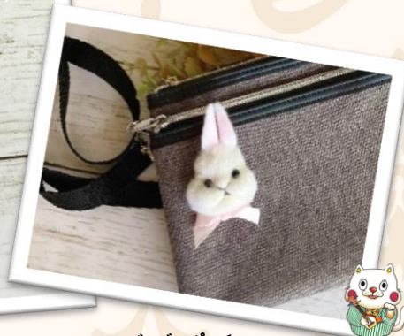
バッグやポーチ、お洋服に付けてもかわいい♪

羊毛を針でつついて、かわいいウサギのミニブローチを作ります。 はじめての方もお子様も気軽にご参加ください！