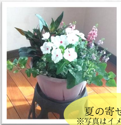
夏の寄せ植え ※写真はイメージです

初めてでも大丈夫！ お花同士の相性・育て方を知って 彩り豊かな寄せ植えを作りましょう。