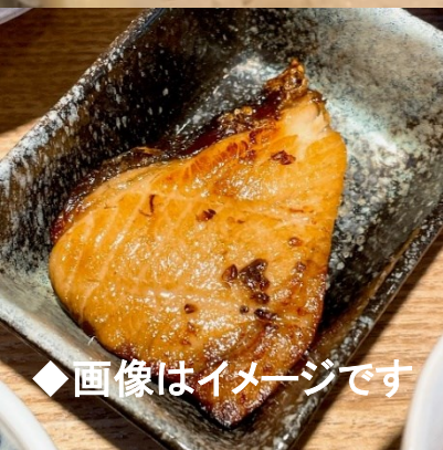
◆画像はイメージです

旬を迎える鯛をまるまる一尾使って捌くことから始めて、鯛めしと焼き物を作ります。 鯛を余すことなくいただきます。